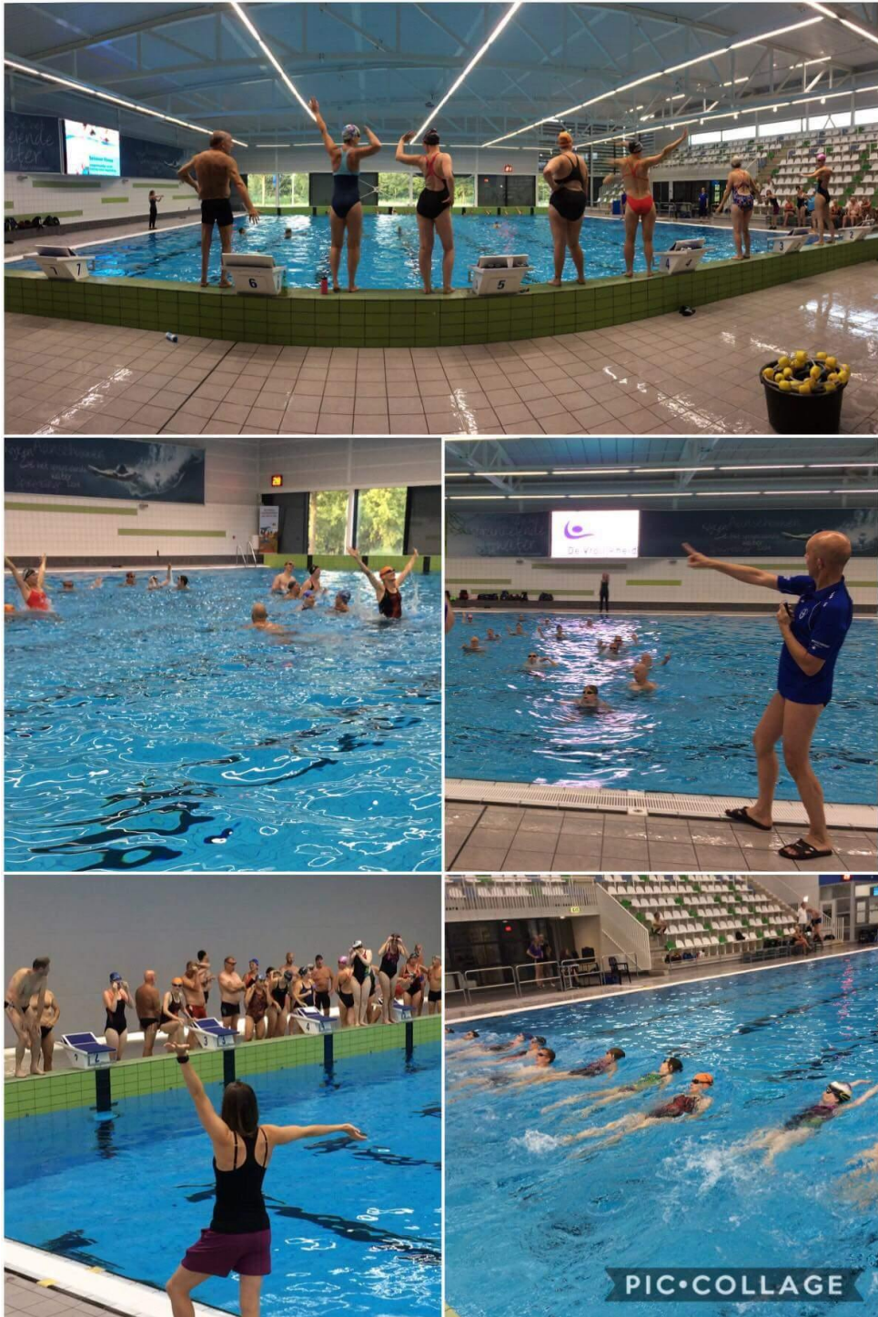
De seizoen afsluiting onder leiding van de afdeling synchroon