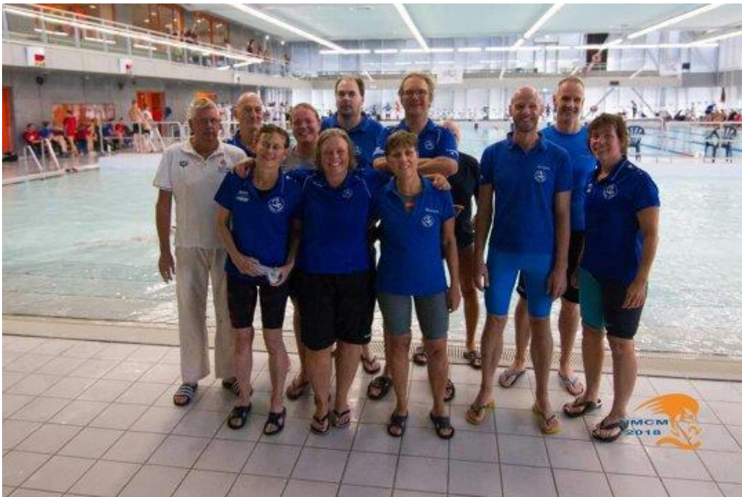
De masters van het NK teams

Hieronder enkele foto-impresies van onze afdeling: